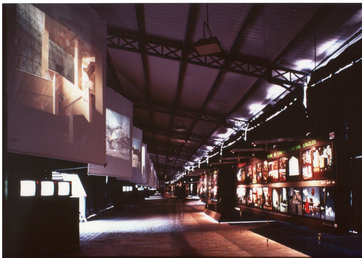
Vue d'exposition de la section Architecture à la Nouvelle Biennale de Paris 1985 à la Grande Halle de la Villette.